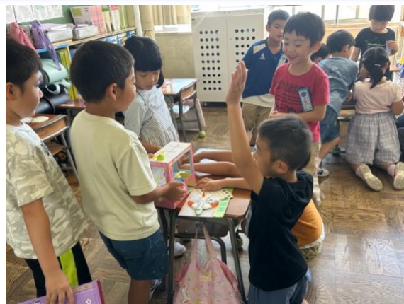
夏休みの作品の交流をする1年生

明日からは、教育実習が始まります。子供自身が様々な活動をつくっていくことが楽しみです。